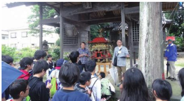
地域探検で勝宿弥神社を訪問

少子高齢化等による公民館行事への参加者の減少や地域コミュニティの劣化という地域課題としっかり向き合い、地域の再発見、地域への愛着と誇りを持った青少年の育成及び次世代リーダーの育成という明確な目標を持った取組が実践されています。