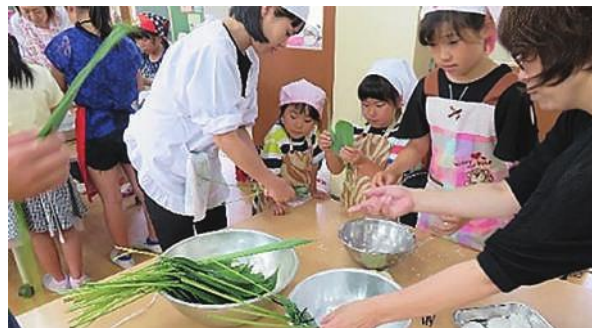
ちまきづくりの様子

2002年の学校週五日制完全実施に伴い、子どもの休日の過ごし方の充実を目指した事業「いきいきおもかげっこ広場」が、20年近く継続され地域に定着しています。