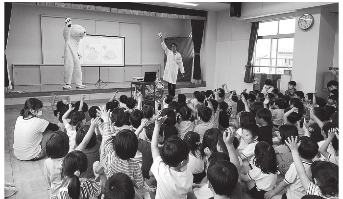
学生とエコサポーターズで行った環境劇