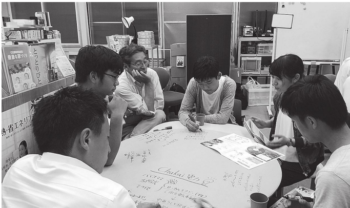
公立鳥取環境大学でのエコ端会議