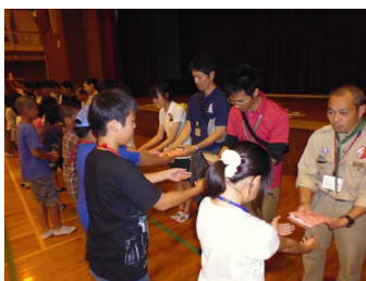
最後に、お世話になった班付きリーダーさんにプレゼントを渡しました。「楽しい1日をありがとうございました!」