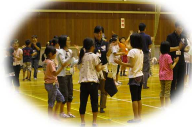
仲間づくりゲーム。みんなリスマ感抜群! 汗が出るほどおどったよ!