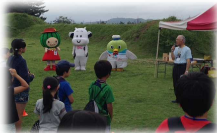
なつみちゃん、カウイ、トリーピーも駆けつけてくれました。

第36回中部地区少年少女のつどいを北栄町で開催しました。出荷が始まったばかりの大栄スイカや、長いもの入ったとろろ汁を堪能したり、コナン通りをクイズラリーしたりと、中部地区の友達と楽しい時間を過ごしました。また、5名の中高生ボランティアが、上手な声かけで活動を支援してくれました。ありがとうございました。