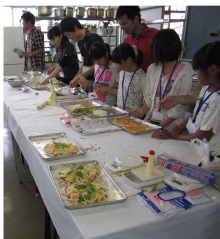
ピザづくり。みんなで協力してトッピング!