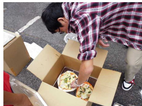
段ボールを使って、ピザを焼いたよ! 下には炭が置いてあります。