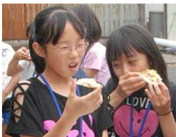
かりっとしていておいしいピザだったよ!