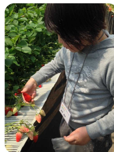
【あぐりキッズでのいちご狩り体験】

中部地区各市町や各団体で子どもの体験活動等の事業が始まっています。少年少女のつどいを始め、JA のあぐりキッズスクール、船上山少年自然の家のロックライミング&ツリーイング教室など魅力ある取組が目白押しです。このおたよりでもどんどん紹介していきたいと思ひます。