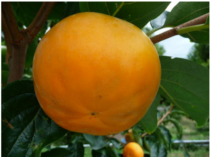
写真1 収穫期の「輝太郎」