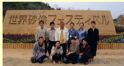
小畑つくし会のメンバー(一部)