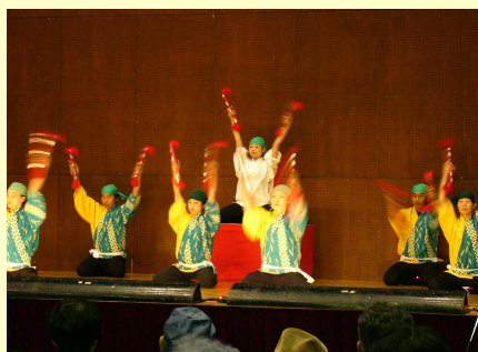
青谷ようこそ祭りでの傘踊り(上)と銭太鼓(下)の演技