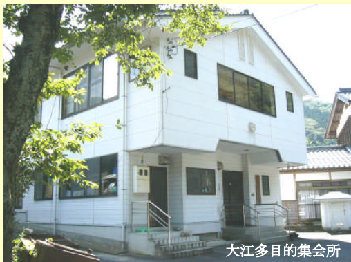
大江多目的集会所