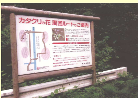
岩美町わかまちづくり交付金を受け周回ルートづくりと案内看板を製作