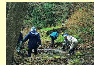
周回ルート整備事業の様子