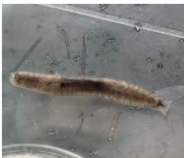
尾端が切れて再生した個体(採餌直後でいつもより少し太め)。 大山川床阿弥陀川 2021.10.15