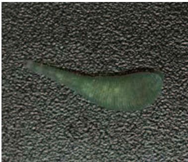
県外（宮城県）採集個体 2013.7.3

■ 選定理由 ：県内における生息確認事例は限定的であるが、評価に必要な情報に乏しく、情報不足として選定した。