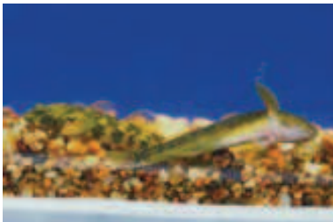
鳥取市用瀬町用瀬 2010.8.18

■ 選定理由 ：近年の降水量増加や集中豪雨および災害復旧工事などによる濁水の流入で、河川の中・上流域の急流部の主たる生息場所は狭められており、生息数も少ない。