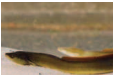
鳥取市湖山池 2001.4.5 / 撮影: 安藤重敏

■ 選定理由 : 近年全国的にシラスウナギの遡上量が減少している。また、取水堰堤や防潮水門の設置および洪水対策護岸などにより、河川での生息環境が悪化している。