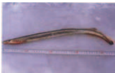
鳥取市浜坂千代川 1996.2.21

■ 選定理由 : 県内の一級河川における最近 20 年間の各種調査において全く確認されていない。また、聞き取り調査でも情報がない。海から遡上する個体数が極端に減少していると考えられる。