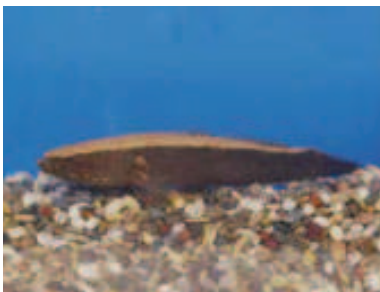
鳥取市賀露町 1998.9.20