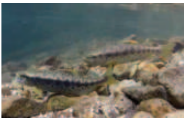
雌と雄 (右) 日野川水系 2021.10.22