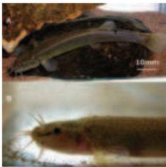
A 雌の全身 B 雌の吻側部 鳥取市円護寺 2008.11.3