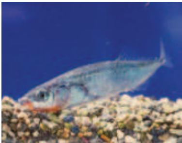
2005 年以降湖山池周辺では確認されていない、湖山池流入河川 2005.6.2

■ 選定理由 ：前回の「イトヨ日本海型」に相当。近年海からの遡上個体がほとんど確認されていない。水田周辺の産卵環境も著しく悪化している。