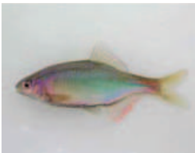
婚姻色が発達した雄 小松谷川 2021.5

■ 選定理由 ：県内唯一の生息域の主要個体群が、近年急速に衰退している。 ■ 特徴 ：種アカヒレタビラは日本固有で、全長8 cm程度、地色は淡い青紫色で胴部後半に青色縦帯、鰓蓋上部後方に暗青緑色斑がある。雑食性で、寿命は長くても3年。産卵期は5月前後、産卵母貝にはカラスガイ族(ヌマガイ・タガイ)を利用。形態と生態が地理的に変異し、5亜種に区分されている。山陰と北陸に分布する本亜種ミナミアカヒレタビラ jordani では、婚姻色が発達した雄は青鱗・青鱗外縁が桃色になり、稚魚・未成魚の背鱗には淡い黒斑がある。