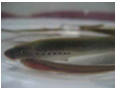
鳥取市国府町袋川 2007.11.27

■ 選定理由 : 河川の中流から下流にかけての限られた環境下でなければ生息できないが、近年の河川工事や水質悪化で生息地が失われている。