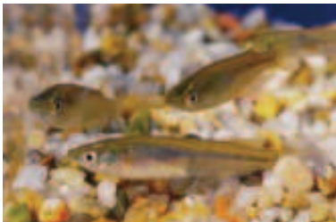
鳥取市青谷町青谷 2015.4.21

■ 選定理由 ：かつては県内各地に生息していたが、従来の生息地やその周辺の圃場整備や宅地化が進み、農薬の使用や水路整備などによる生息環境の悪化や進んだ。そのため生息数が減少している。