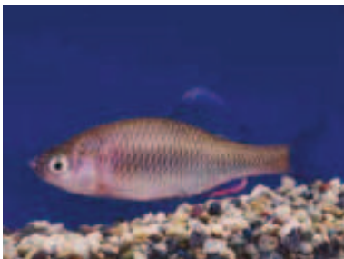
気高町高江 2002.7.12

■ 選定理由 ：生息地の環境悪化と産卵基質となるイシガイ科二枚貝の減少により、近年の生息数が激減している。県内最大の淡水域であった湖山池への海水導入により、池および流入河川の本種群は壊滅的な状況となった。