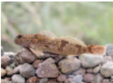
三朝町上西谷 2021.9.26