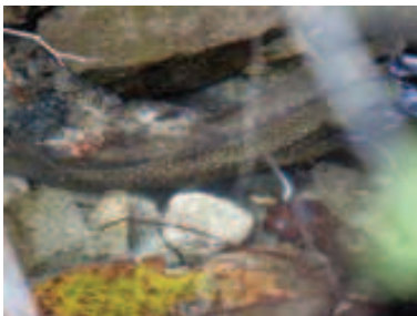
雌と雄（奥） 日野川水系 2020.11.2

■ 選定理由 ：河川上流域に局所的に生息しているが、開発や他系統のイワナの移植放流により在来の個体群が減少の一途をたどっているため。