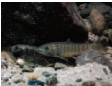
雌と雄 (右) 千代川水系 2021.11.3