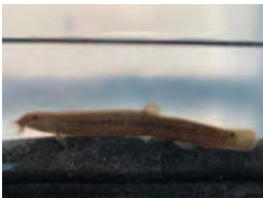
鳥取市袋川 2021.10.11

■ 選定理由 ：生息環境の悪化や近縁外来種の分布拡大等により個体数の減少が危惧されるが、生息状況などを判定するに足る情報が得られていないため。