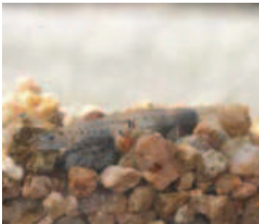
湯梨浜町野花 (東郷池) 2021.3.23

■ 選定理由 ：産卵場所は、潮の影響を受けない河川・湖沼の砂礫底であり、県内の産卵場所が極端に減少している。