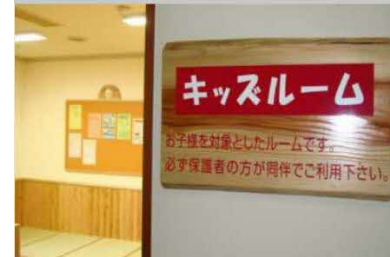
キッズルームの整備