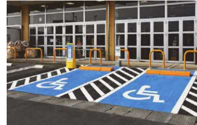
わかりやすい車椅子使用者用駐車場