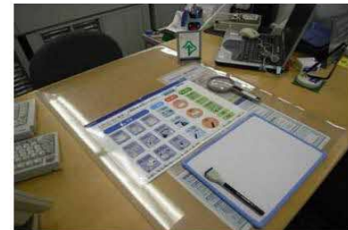
コミュニケーションボード等の常備