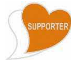
あいサポートバッジ

バッジのデザインは、障がいのある方を支える「心」を2つのハートを重ねることで表現しています。