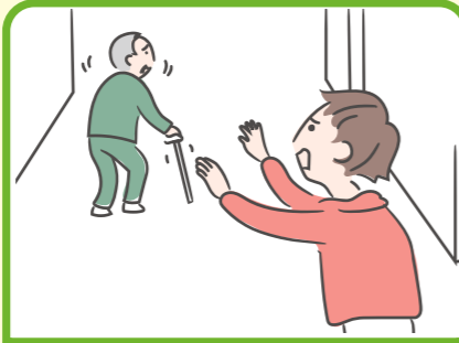
目を離せない家族の見守りや声掛けなどを行っている