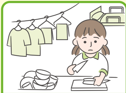
障がいや病気のある家族に代わり、多くの家事をしている