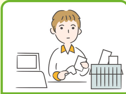
家計を支えるために労働をして家族を助けている