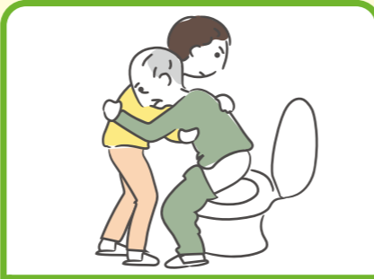
障がいや病気のある家族の入浴やトイレの介助をしている