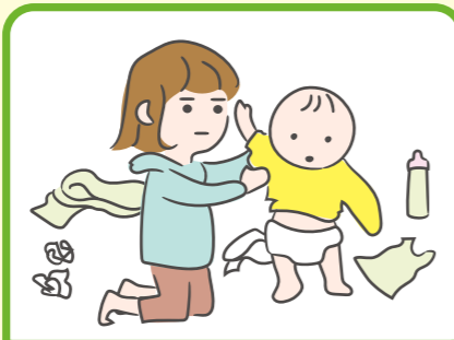
家族に代わり、幼いきょうだいの世話をしている