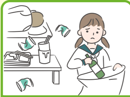
アルコール・薬物・ギャンブル問題をかかえる家族に対応している