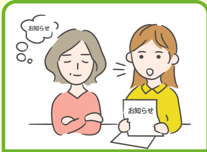
日本語が第一言語でない家族や障がいのある家族のために通訳をしている