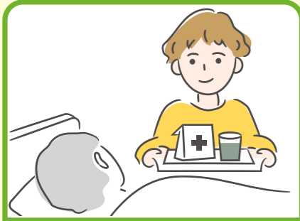
障がいや慢性的な病気のある家族の身の回りの世話や看病をしている