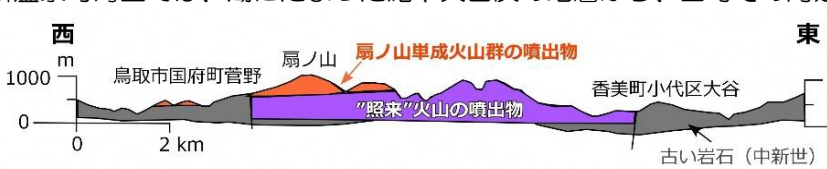
図4 鳥取市国府町～香美町小代区間の断面図 小室ほか(2001)のFig.3を一部改変。

[図3参考文献] 地質調査総合センター「第四紀火山岩体・貫入岩体データベース」(ウェブサイト); Furuyama et al. (1993); 古山ほか(1993; 1998); 先山ほか(1995); Nguyen (2018); Velasco et al. (2018); 和田ほか(1990) など