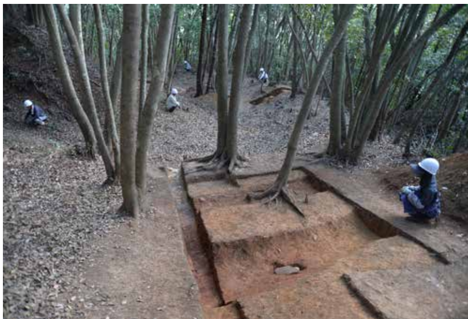
養郷宮之脇遺跡で見つかったつづら折りの道路遺構