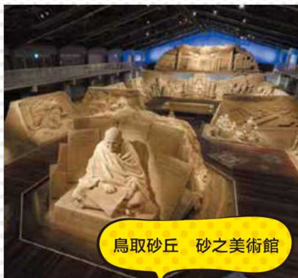
鳥取砂丘 砂之美術館

■時間/9:00~17:00 ■交通/從倉吉站巴士總站2號搭車處搭乘市內線。在「廣瀨町」下車,步行5分鐘。(票價300日圓)