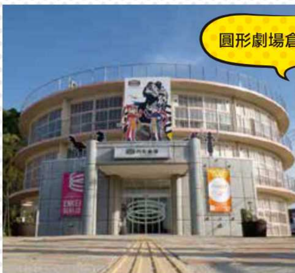
圓形劇場倉吉公仔模型博物館

■時間/9:00~17:00(閉館前20分鐘截止入館) ■休館日/每月的第1、3、5個週一(國定假日時改為不是休息日的第二天)、12月29日~1月3日 ■交通/從JR倉吉站巴士總站2號搭車處搭乘。在「倉吉公園廣場北口」下車,步行5分鐘。(票價200日圓)