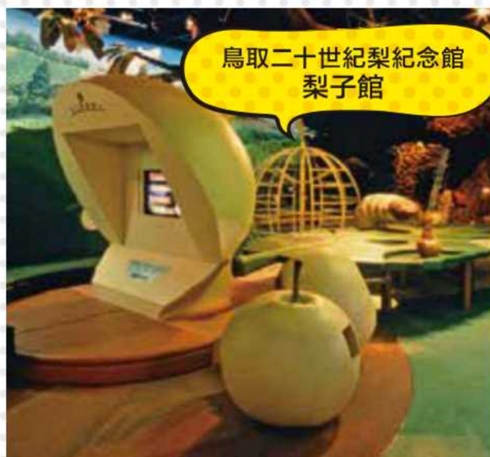
鳥取二十世紀梨紀念館 梨子館

■時間/9:30~17:30(閉館前30分鐘截止入館) ■無休 ■交通/從JR由良站(柯南站)步行約20分鐘或搭乘計程車約5分鐘