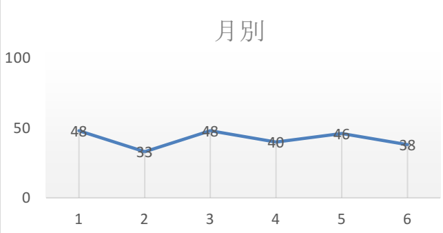
人身事故発生状況