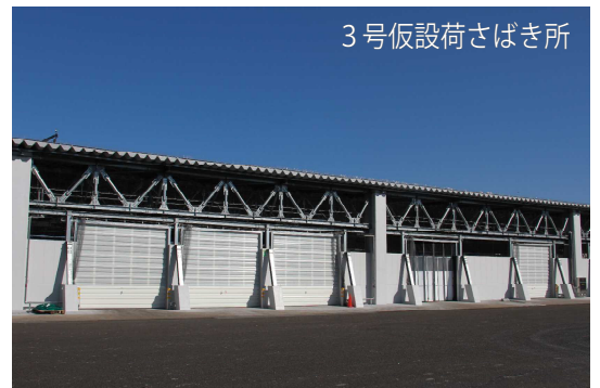
3号仮設荷さばき所

1号上屋、2号上屋の改築中に仮設の荷さばき所として活用する3号仮設荷さばき所と、旧トラックスケール解体に伴い建設するトラックスケールが完成しました。