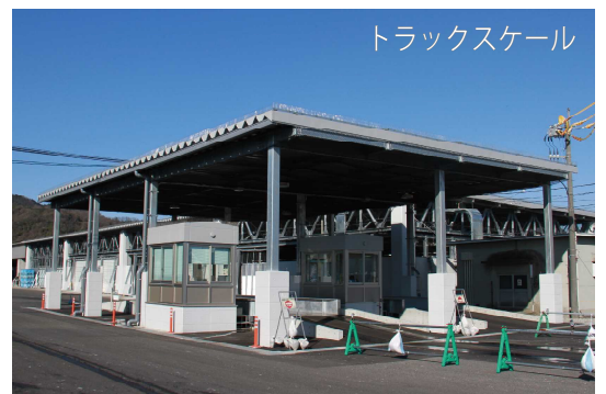
トラックスケール