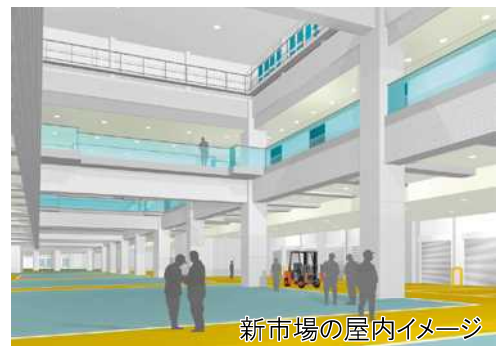
新市場の屋内イメージ