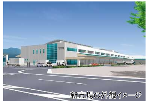
新市場の外観イメージ

東京五輪が開催される2020年(平成32年)までに主要部分の供用開始を目指して、平成28年度から高度衛生管理型漁港・市場整備を開始しています。