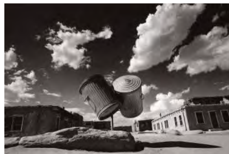
1.フェリーチェ・ベアト(長崎、中島川)1865年頃、鶏卵紙 2.安井仲治《海濱》1936年、ゼラチン・シルバー・プリント 3.林忠彦《太宰治》1946年、ゼラチン・シルバー・プリント 4.牛嶋茂雄《(SELF AND OTHERS)より》1977年、ゼラチン・シルバー・プリント 5.立木義浩《(舌出し天使)より》1965年、ゼラチン・シルバー・プリント 6.野町和嘉《ライラトル・カドルの礼拝 ムッカ》1995年、発色現像方式印画 7.奈良原一高《アメリカ・インディアンの二つのゴミ缶(消滅した時間)より》1972年、ゼラチン・シルバー・プリント ※掲載作品はすべて富士フィルム株式会社蔵