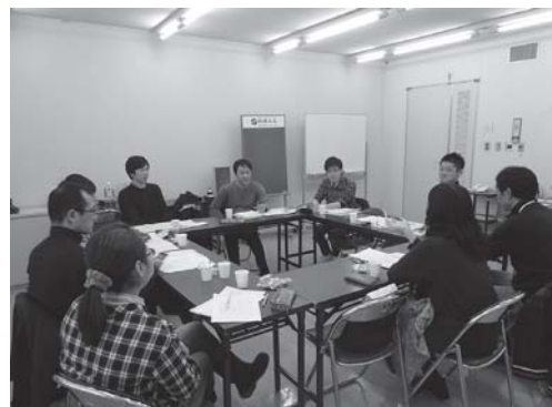
鳥取県青年問題研究集会（毎年1月開催）

勤労青年が日ごろ取り組んでいるスポーツ、文化活動の発表の場とし、互いに切磋琢磨しながら青年活動を盛り上げていく。