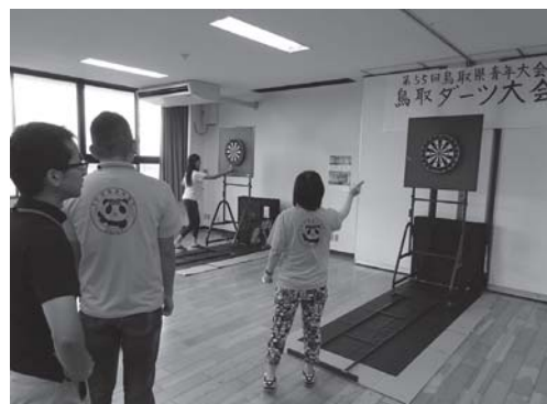
鳥取県青年大会（毎年9月開催）

勤労青年が日ごろ取り組んでいるスポーツ、文化活動の発表の場とし、互いに切磋琢磨しながら青年活動を盛り上げていく。