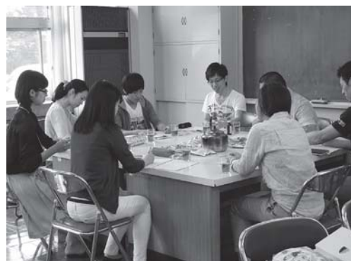
活動家養成セミナー

県内青年のリーダー養成と資質向上を図り、これからの活動につなげる。青年組織の拡充と、他組織との交流の場とする。