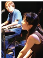
合唱曲「COSMOS」 でおなじみの「アクアマリン」