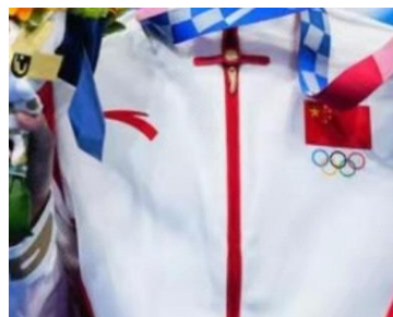
中国選手のユニフォーム

おそらく多くの日本人にとって馴染みのないロゴマークだったと思いますが、中国選手たちが着ていたのは、中国のスポーツブランド「安踏（ANTA）」のユニフォームでした。「安踏（ANTA）」は中国のオリンピック協賛企業である中国最大の総合スポーツアパレル企業「アンタスポーツ（安踏体育）」のブランド名で、近年、中国国内で急速に市場シェアを伸ばしています。1991年に福建省で創業したアンタスポーツは2007年に香港株式市場で上場を果たした後、2019年にはArc' Teryx, Salomon, Wilson, Suunto, Atomicなどのブランドを抱えるフィンランドのアメアスポーツを買収するなど規模の拡大を進めており、日本のDESCENTE（デサント）にも出資しています。