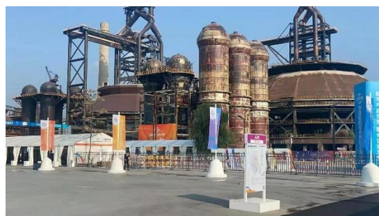
公園内に残る「首鋼」の工場跡