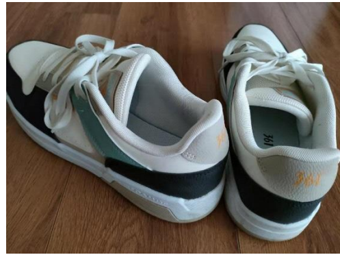
中国で購入した筆者の靴（361°）

一つ目は国の支援。先日、中国国務院は全国民がスポーツに参加することを目的とした国民健康づくり計画（2021～25年）を発表しました。計画によると、2025年までに国民の健康づくりのための公共サービスを充実させ、日常的にスポーツで体を鍛える人々の割合を38.5%に高めるといいます。背景には、急速に進む中国社会の高齢化があります。2018年時点の中国人の平均予想寿命は77歳になりましたが、健康予想寿命は68.7歳と10歳近い開きがあり、国民の健康寿命を引き上げることが喫緊の課題となっています。9月7日の時事速報北京・華北版でも「6日公表された「北京市老齡事業發展報告（2020）」で、北京市の常住人口に占める60歳以上の高齢者の割合が2020年末に19.64%とほぼ2割まで上昇（4年で51万人増加）し、高齢化は深刻である。」と報じています。そのため政府は、中国全土で徒歩15分圏内に健康づくり施設を配置し、社会スポーツ指導員を人口1,000人あたり2.16人確保するほか、スポーツ産業を5兆元（約80兆円）規模に拡大させるとしています。スポーツ産業の市場規模は2019年時点で2兆9,483億元だったとされることから、わずか6年間で約2兆元（約32兆円）も積み上げられることとなります。来年初めには北京冬季五輪の開催も控えており、中国のスポーツ関連市場は今後も当分の間、成長が続くのではないのでしょうか。