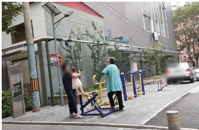
街角にある健康器具

一つ目は国の支援。先日、中国国務院は全国民がスポーツに参加することを目的とした国民健康づくり計画（2021～25年）を発表しました。計画によると、2025年までに国民の健康づくりのための公共サービスを充実させ、日常的にスポーツで体を鍛える人々の割合を38.5%に高めるといいます。背景には、急速に進む中国社会の高齢化があります。2018年時点の中国人の平均予想寿命は77歳になりましたが、健康予想寿命は68.7歳と10歳近い開きがあり、国民の健康寿命を引き上げることが喫緊の課題となっています。9月7日の時事速報北京・華北版でも「6日公表された「北京市老齡事業發展報告（2020）」で、北京市の常住人口に占める60歳以上の高齢者の割合が2020年末に19.64%とほぼ2割まで上昇（4年で51万人増加）し、高齢化は深刻である。」と報じています。そのため政府は、中国全土で徒歩15分圏内に健康づくり施設を配置し、社会スポーツ指導員を人口1,000人あたり2.16人確保するほか、スポーツ産業を5兆元（約80兆円）規模に拡大させるとしています。スポーツ産業の市場規模は2019年時点で2兆9,483億元だったとされることから、わずか6年間で約2兆元（約32兆円）も積み上げられることとなります。来年初めには北京冬季五輪の開催も控えており、中国のスポーツ関連市場は今後も当分の間、成長が続くのではないのでしょうか。