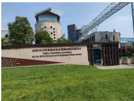
北京五輪組織委員会