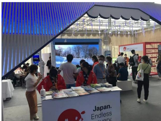
鳥取県の動画を見る来場者

ちなみに今回展示会場となった「北京首鋼園」は鉄鋼メーカーである首鋼の工場跡地で産業遺産である製鉄エリアの景観を残しながらハイエンドオフィスや飲食店などが集まる新たなコミュニティエリアとして再開発が行われており、園内ではスケートボードやボルダリングができるほか、オリンピック組織委員会もここに 있습니다。