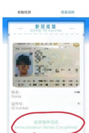
ワクチン接種完了画面 (北京市「健康コード」)

平穏を取り戻しつつある一方、新型コロナウイルスの感染者ゼロを目指して厳格な防疫措置を取る中国では、ワクチン未接種者に対する責任追及を警告する地方都市が相次ぐなど問題も発生しています。複数の都市が「ワクチン未接種者が感染を引き起こした場合、法律法規に基づき責任を追及する」と通知したほか、ある市では未接種者に対し、地下鉄やスーパー、映画館、病院などへの立ち入りを原則認めないといった動きもあるようです。中国では市中感染が発生した地域は地元幹部の責任が追及されるため、あの手この手で接種率を上げようとする動きが広がっており、北京五輪が終わるまでは、まだまだ緊張が続きます。