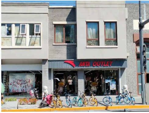
北京市内にある「ANTA」のアウトレット店