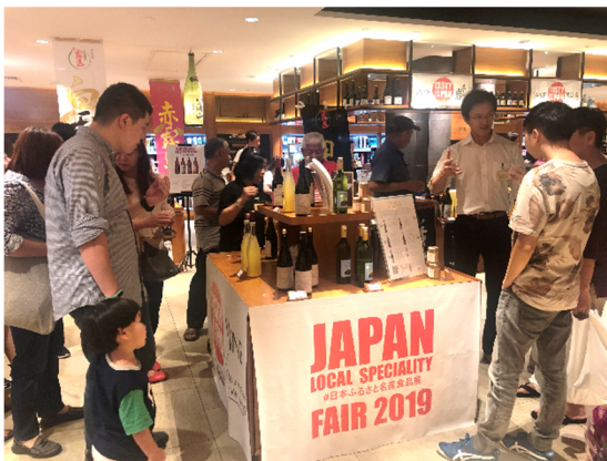
食品展事業@クアラルンプール