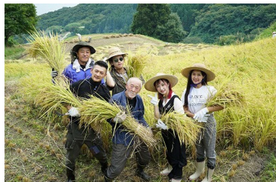
招聘事業@新潟（中国から招聘）

そのほか経済交流課では、クレアのホームページを利用して、自治体のインバウンドや海外販路開拓に関する取組を紹介しており、その紹介記事は各職員が持ち回りで執筆することになっています。私も過去3回執筆（下記参照）を担当しておりますので、皆さんもお時間がありましたら是非御覧ください。