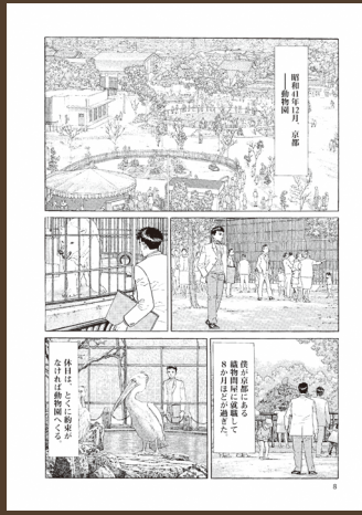
「冬の動物園」©パビエ