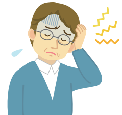
思考力・集中力の低下