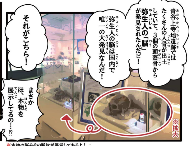
※本物の脳みその断片が展示してあるよ！