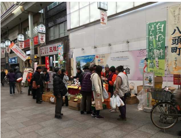
昨年開催した農産物フェアの様子

十二月二日(金)、三日(土)の二日間、今年最後の八頭町物産販売を、大阪市北区の天神橋二丁目商店街ササキ理容様前にて開催します。若手農業者で組織している、八頭町農業青年会議の会員五名が、旬のフルーツ、新鮮野菜、はちみつ、加工品等を販売します。生産者自ら販売しますので、美味しい食べ方、栽培方法等を直接聞きながら購入できます。なお、初日は交通事情等により販売開始時間が多少前後する場合があります。ご了承ください。