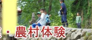
農作業・農村体験