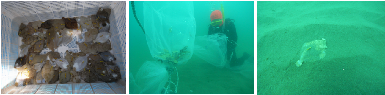
図2 放流前の標識装着メイタガレイと放流実施状況及び海底に潜砂した稚魚（平成21年4月30日）