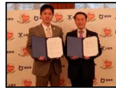
大阪市 (H29.11.10) 和泉市 (H30.11.5) 大阪府 4,282人