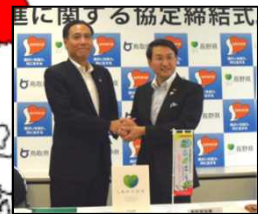
長野県 (H25.7.1) 66,003人