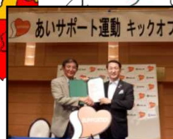
和歌山県 (H28.8.31) 14,300人