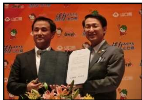
山口県 (H27.8.9) 26,077人