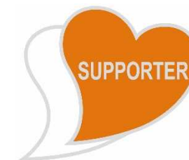
あいサポートバッジ

バッジのデザインは、障がいのある方を支える「心」を2つのハートを重ねることで表現しています。