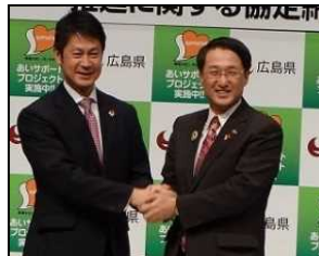
広島県 (H23.12.11) 240,731人