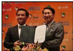
山口県 (H27.8.9) 25,268人