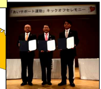
富士見市・三芳町 (H26.10.16) 秩父市・横瀬町・皆野町 長瀬町・小鹿野町 (H27.11.6)