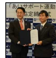
神奈川県大和市 (H31.2.1) 369人