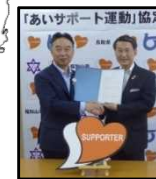
長岡京市 (H30.5.13) 福知山市 (H30.5.30) 京都府 2,551人