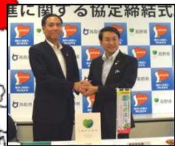
長野県 (H25.7.1) 65,406人