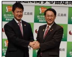
広島県 (H23.12.11) 240,387人