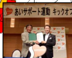
和歌山県 (H28.8.31) 13,481人