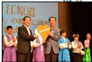
【初の海外進出】 韓国江原道 (H26.10.4)

あいサポーター数: 549,396人 / あいサポーター研修実施回数: 7,583回 あいサポート企業・団体認定数: 2,131企業・団体 (令和2年9月末現在)