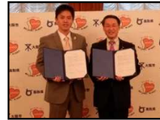
大阪市 (H29.11.10) 和泉市 (H30.11.5) 大阪府 3,934人