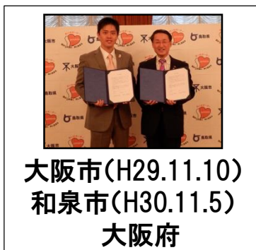
大阪市(H29.11.10) 和泉市(H30.11.5) 大阪府 1,372人