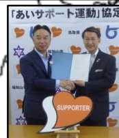
長岡京市(H30.5.13) 福知山市(H30.5.30) 京都府 1,846人