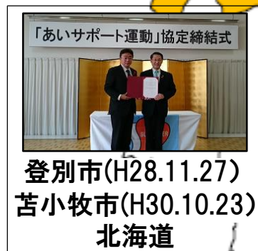
登別市(H28.11.27) 苫小牧市(H30.10.23) 北海道 2,296人