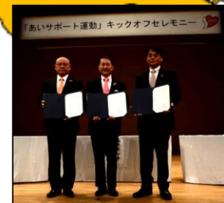
富士見市・三芳町 (H26.10.16) 秩父市・横瀬町・皆野町 長瀬町・小鹿野町 (H27.11.6) 狭山市(H30.7.3) 川口市(H31.1.17) 和光市(H31.1.17) 埼玉県 9,121人