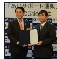
神奈川県大和市 (H31.2.1) 55人