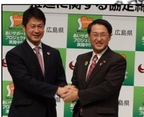
広島県 (H23.12.11) 188,610人