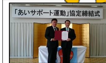
登別市(H28.11.27) 苫小牧市(H30.10.23) 北海道 2,034人