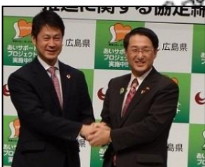
広島県 (H23.12.11) 188,355人