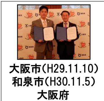
大阪市(H29.11.10) 和泉市(H30.11.5) 大阪府 1,331人