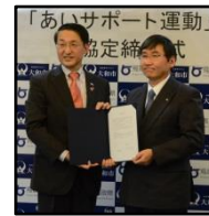
神奈川県大和市 (H31.2.1) 55人