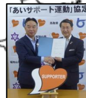
長岡京市(H30.5.13) 福知山市(H30.5.30) 京都府 1,757人