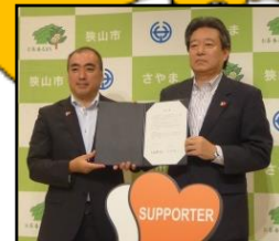
富士見市・三芳町 (H26.10.16) 秩父市・横瀬町・皆野町 長瀬町・小鹿野町 (H27.11.6) 狭山市(H30.7.3) 川口市(H31.1.17) 和光市(H31.1.17)