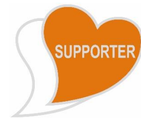
あいサポートバッジ

バッジのデザインは、障がいのある方を支える「心」を2つのハートを重ねることで表現しています。