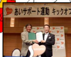
和歌山県 (H28.8.31) 14,420人