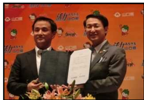
山口県 (H27.8.9) 26,116人