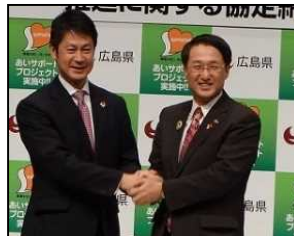
広島県 (H23.12.11) 240,732人