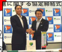
長野県 (H25.7.1) 66,192人