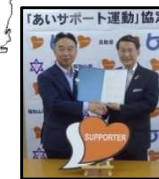
長岡京市 (H30.5.13) 福知山市 (H30.5.30) 京都府 2,698人