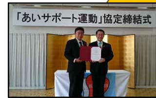
登別市 (H28.11.27) 苫小牧市 (H30.10.23) 北海道 3,792人