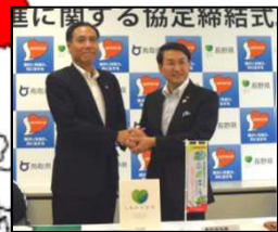
長野県 (H25.7.1) 65,120人