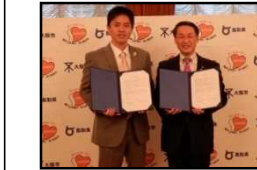
大阪市 (H29.11.10) 和泉市 (H30.11.5) 大阪府 3,672人