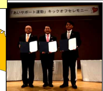
富士見市・三芳町 (H26.10.16) 秩父市・横瀬町・皆野町 長瀬町・小鹿野町 (H27.11.6)