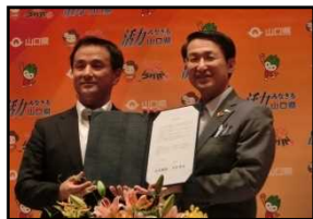
山口県 (H27.8.9) 24,882人