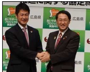
広島県 (H23.12.11) 240,189人