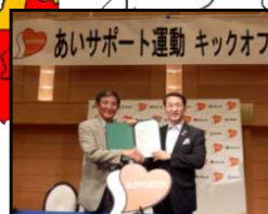
和歌山県 (H28.8.31) 13,067人