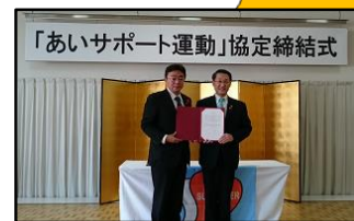
登別市 (H28.11.27) 苫小牧市 (H30.10.23) 北海道 3,443人