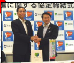
長野県 (H25.7.1) 64,992人