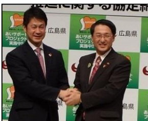
広島県 (H23.12.11) 240,176人