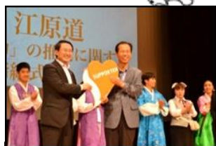
【初の海外進出】 韓国江原道 (H26.10.4)

あいサポーター数: 543,531人 / あいサポーター研修実施回数: 7,342回 あいサポート企業・団体認定数: 2,052企業・団体 (令和2年2月末現在)