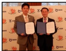
大阪市 (H29.11.10) 和泉市 (H30.11.5) 大阪府 3,612人