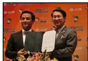
山口県 (H27.8.9) 24,721人