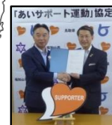
長岡京市 (H30.5.13) 福知山市 (H30.5.30) 京都府 2,464人