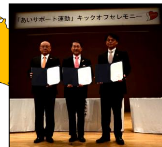
富士見市・三芳町 (H26.10.16) 秩父市・横瀬町・皆野町 長瀬町・小鹿野町 (H27.11.6) 狭山市 (H30.7.3) 川口市 (H31.1.17) 和光市 (H31.1.17) 埼玉県 12,108人