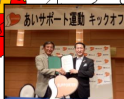
和歌山県 (H28.8.31) 12,664人