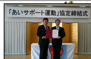
登別市(H28.11.27) 苫小牧市(H30.10.23) 北海道 2,735人