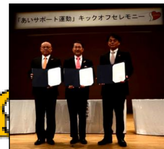
富士見市・三芳町 (H26.10.16) 秩父市・横瀬町・皆野町 長瀬町・小鹿野町 (H27.11.6) 狭山市(H30.7.3) 川口市(H31.1.17) 和光市(H31.1.17) 埼玉県 11,294人