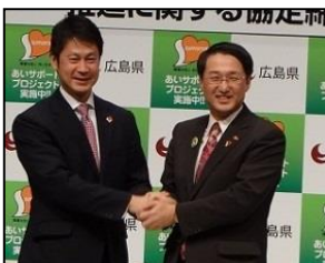
広島県 (H23.12.11) 230,768