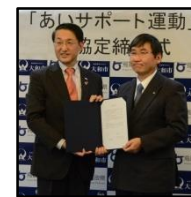
神奈川県大和市 (H31.2.1) 243人