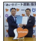
長岡京市(H30.5.13) 福知山市(H30.5.30) 京都府 2,166人