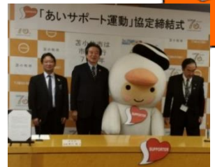
苫小牧市 (H30.10.23) 415人