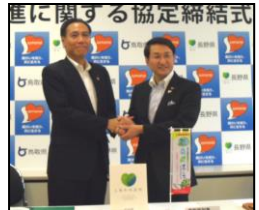
長野県 (H25.7.1) 58,582人