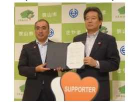
狭山市 (H30.7.3) 埼玉県 8,364人