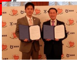
大阪市 (H29.11.10) 722人