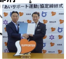
福知山市 (H30.5.30) 969人