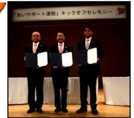
富士見市・三芳町 (H26.10.16)