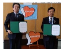
大阪府和泉市 (H30.11.5) 0人