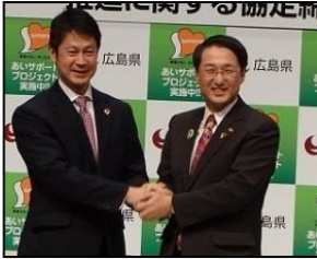
広島県 (H23.12.11) 187,789人