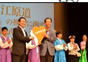
【初の海外進出】 韓国江原道 (H26.10.4)

あいサポーター数: 446,854人 / あいサポーター研修実施回数: 5,996回 あいサポート企業・団体認定数: 1,743企業・団体 (平成30年12月末現在)