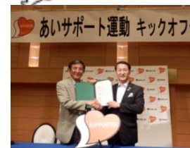
和歌山県 (H28.8.31) 9,434人