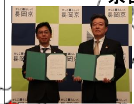
長岡京市 (H30.5.13) 119人