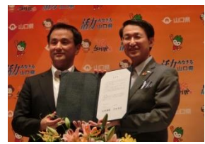
山口県 (H27.8.9) 17,898人