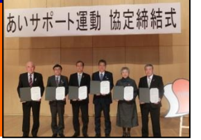
秩父市・横瀬町・皆野町 長瀬町・小鹿野町 (H27.11.6)