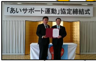
登別市(H28.11.27) 苫小牧市(H30.10.23) 北海道 2,479人