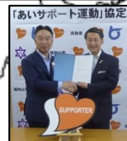
長岡京市(H30.5.13) 福知山市(H30.5.30) 京都府 1,923人