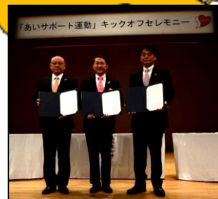
富士見市・三芳町 (H26.10.16) 秩父市・横瀬町・皆野町 長瀬町・小鹿野町 (H27.11.6) 狭山市(H30.7.3) 川口市(H31.1.17) 和光市(H31.1.17) 埼玉県 9,778人