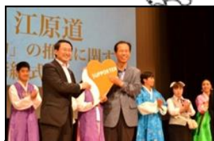
【初の海外進出】 韓国江原道 (H26.10.4)