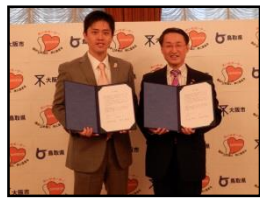
大阪市(H29.11.10) 和泉市(H30.11.5) 大阪府 1,689人