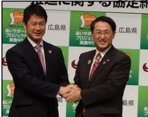
広島県 (H23.12.11) 204,524人