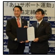
神奈川県大和市 (H31.2.1) 146人