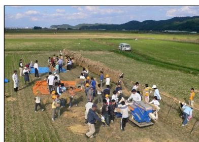
稲刈り・脱穀体験