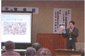
※写真は昨年度国府町で開催した様子

埋蔵文化財センターでは、鳥取県の考古学について広く情報発信するため、職員(文化財主事)が各地に出向き、「出前講演」を行っています。講演の実施にあたっては、講師への謝金は不要です。(旅費についてはご相談ください。)会場については御準備ください(会場使用料等の経費は申込者負担をお願いします)。各種研修会や地域の歴史学習会等でご活用ください。