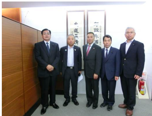
花木代表（中央）を囲んでの記念撮影