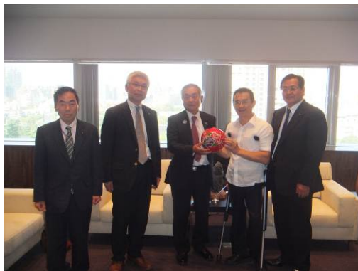
徐副市長（右から2人目）を囲んでの記念撮影