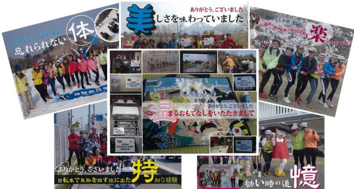
ツアー参加者の皆さんが作成されたパネル