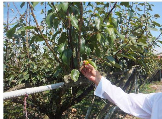
接ぎ木された部分