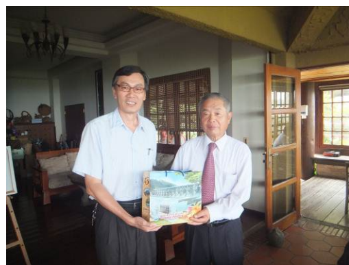
王区長との記念品交換