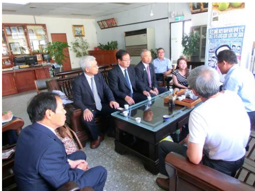
石岡区農会との意見交換の様子

農会は会員によって組織され、石岡区農会の会員数は3,000人余り。主な農産品はぼんかんで栽培面積は約250ヘクタール、年間約4,500トン。