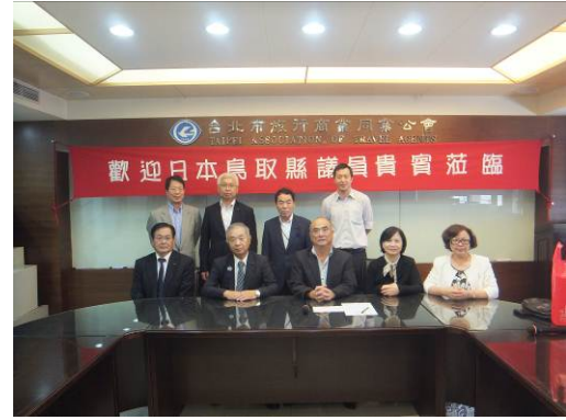
丁副理事長（前列中央）らを囲んで記念撮影