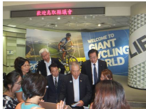
ツアー参加者との意見交換