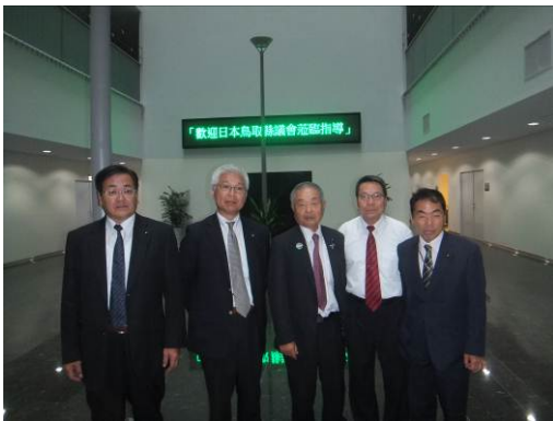
張秘書長（右から2人目）を囲んでの記念撮影