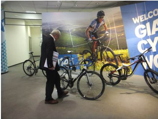
ジャイアント社本社ショールーム