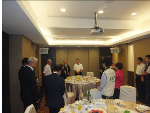
歓迎夕食会の様子

台中市議会主催の歓迎夕食会を開催していただき、議員、秘書長のほか多くの職員と意見交換を行った。