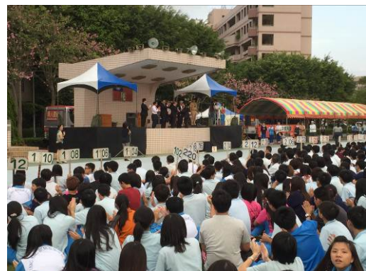
全校生徒へのあいさつ