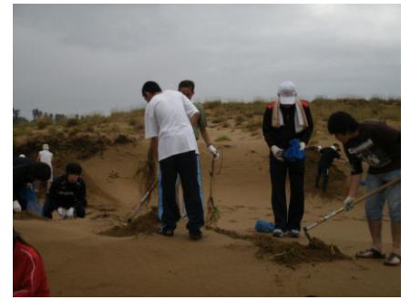
砂丘清掃活動の様子