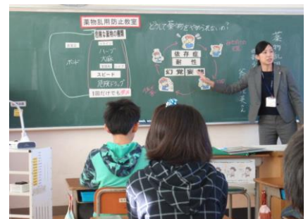
薬物乱用防止教室の様子

学校や保育園などにおいて、パワーポイントや掲示物を活用して、非行・薬物乱用防止、インターネット被害防止（ネット被害・性犯罪被害）について講話や指導などを行っています。