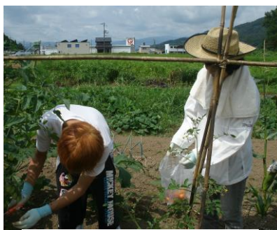
農業体験活動の様子