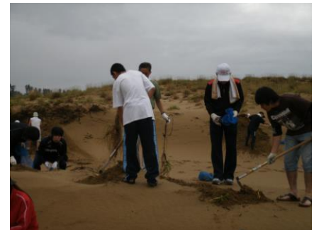
砂丘清掃活動の様子