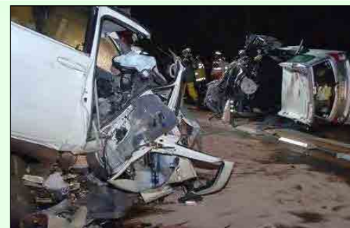
平成22年2月14日、米子自動車道(伯耆町金屋谷)で発生した正面衝突事故で、大学生3名が死亡。

高速道路本来の定時性・安全性の確保を図るため、『米子自動車道(蒜山IC～米子IC)』及び「米子道路」について4車線化を行うこと。