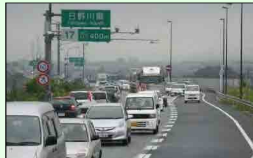
米子道路では、交通量の増加により通勤時間帯を中心に交通渋滞が発生