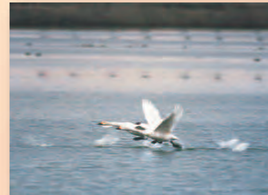
米子水鳥公園(米子市) コハクチョウ集団越冬南限地