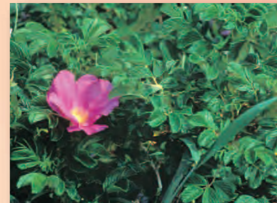
白兎海岸(鳥取市)、松河原海岸(大山町) はまなす自生南限地帯