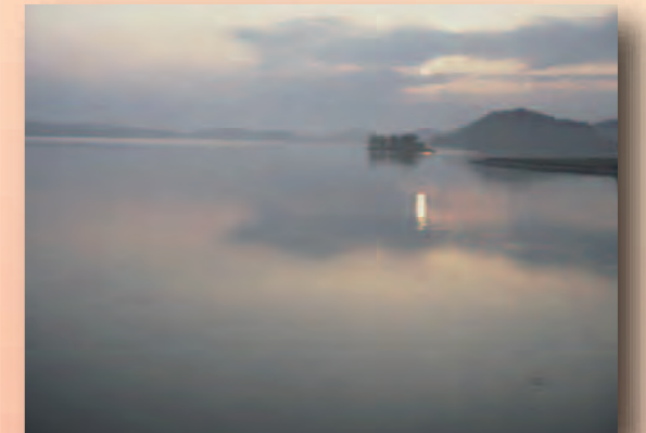
湖山池(鳥取市) 湖水面積日本一(6.9km 2 )の池