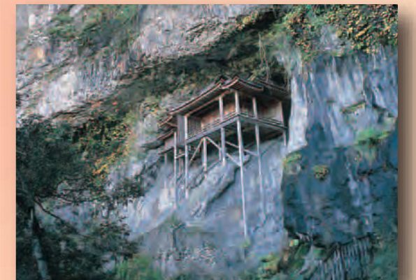
三徳山三仏寺投入堂(三朝町) 神社本殿形式の建築物では、日本最古級