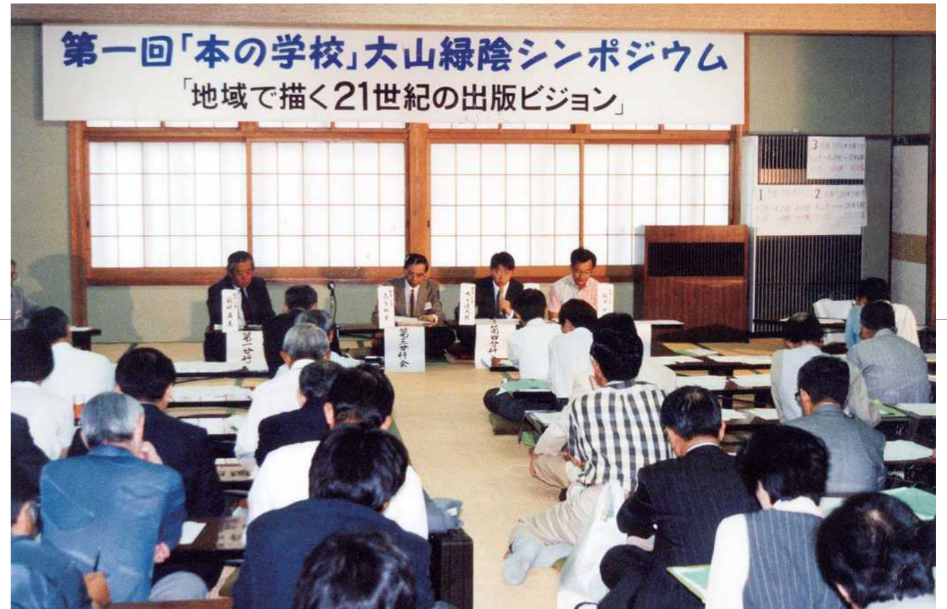
出版、図書館、教育、マスコミの各業界人が大山に集った「第1回「本の学校」大山緑陰シンポジウム」＝1995年9月、大山町

ない。取次店や問屋に選書を丸投げしているようではだめです。書店員、図書館の司書は互いに切磋琢磨（せつさたくま）して本を選ぶ力を養いたいものです」 日本社会の縦割り構造は書店と図書館の関係にも表れている。『隣村』のことすら知らないようでは……。教育、図書館、書店、古本、マスコミ、映像、文化。こうした業界・分野に横串を通し、自由闊達（かっただつ）に意見を交わす場となつたのが、本の学校が誕生した