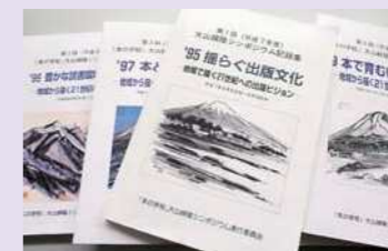
「大山緑陰シンポジウム」は1995年から5年間続けられ、5冊の記録集を残した