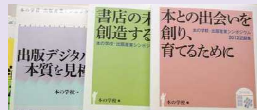
2006年からは「東京国際ブックフェア」会場で、「本の学校・出版産業シンポジウムin東京」を開催。記録集を毎年発行している

市民の読書推進や市町村立図書館の振興、書店人の育成などを目的に1995年1月、米子市に設立された。2012年3月にNPO法人化。①生涯読書推進②出版業界人育成③出版の未来像創造④「学びの場拡充」一などのテーマでシンポジウムやワークショップなどを行っている。