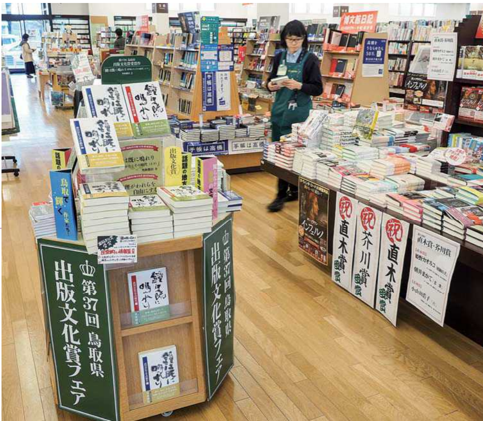
約3千㎡の店舗面積を持つ「本の学校今井ブックセンター」は、子どもからお年寄りまで幅広い客でにぎわう今井書店グループの旗艦店

「ローカル対ローカルで、オープンマインドに交流を広めることも大切です。活動に共感、共鳴してくださる人も増え