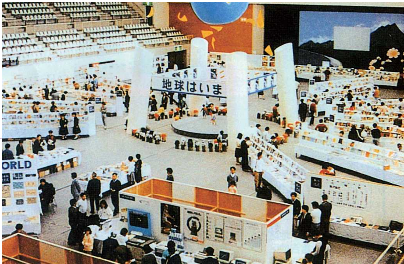
全国で初めての「本の国体ブックインとっとり'87日本の出版文化展」が県内3会場で開かれた＝1987年10月、米子市

国内初の「本の国体」 本の学校の発足へ至る経過の中で、1987年に鳥取、倉吉、米子の3市で開かれた「本の国体ブックインとっとり・日本の出版文化展」も画期的な試みだった。読書推進、市町村立図書館と地方出版の振興を目的し、国内で初開催。読者、著者、出版社、書店や図書館が一体となり、地方出版を含む優れた書籍3万点余を一堂に集めて、シンポジウムや講演会も催した。 実行委員会が3会場にこしらえた模擬図書館には10日間延べ約6万7千人が訪れた。市民グループと書店組合が運営に携わり、良質な本に触れる機会や情報を地方から発信した。