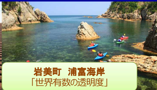
岩美町 浦富海岸 「世界有数の透明度」