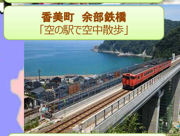
香美町 余部鉄橋 「空の駅で空中散歩」