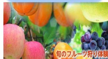
旬のフルーツ狩り体験