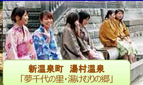
新温泉町 湯村温泉 「夢千代の里・湯けむりの郷」