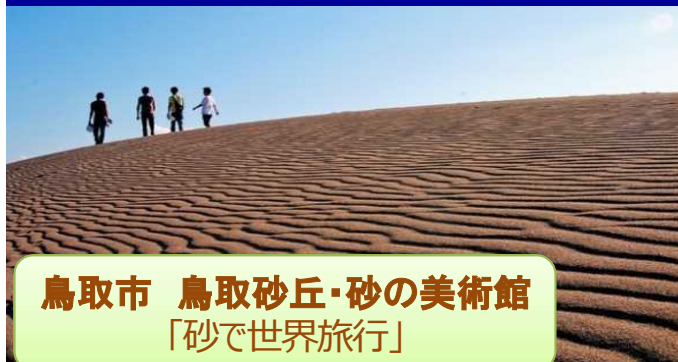
鳥取市 鳥取砂丘・砂の美術館 「砂で世界旅行」