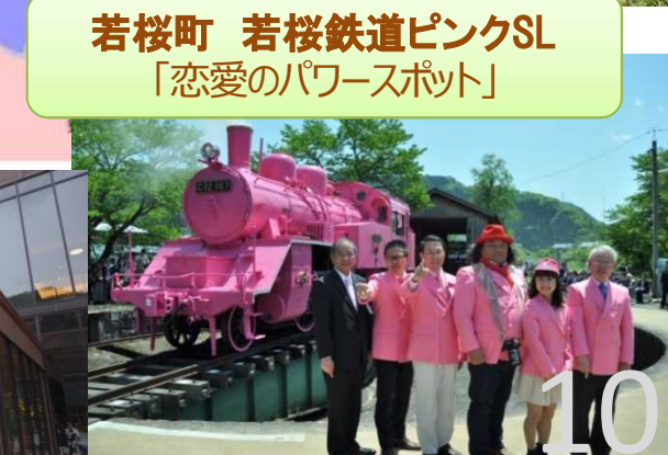
若桜町 若桜鉄道ピンクSL 「恋愛のパワースポット」